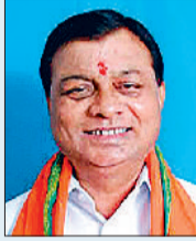
लखनलाल देवांगन उद्योग मंत्री